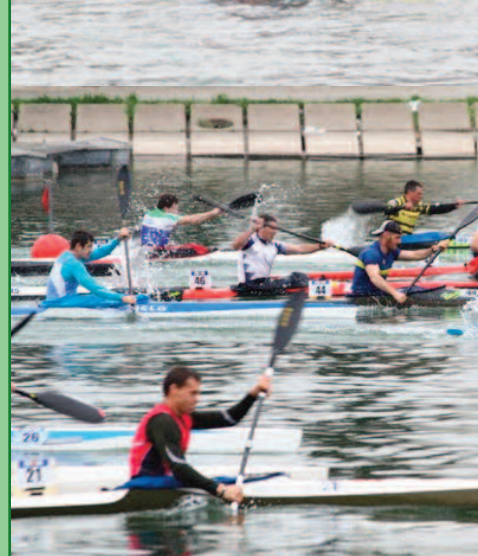
Imágenes: Javier Melús