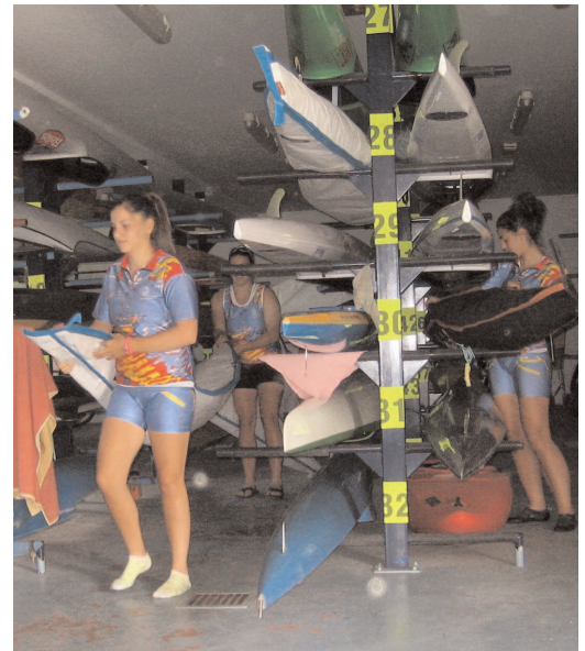
Chicas en las instalaciones del CTD de Río Esgueva.

Jesús R. Inclán • Con la temporada deportiva lanzada el Plan nacional de Tecnificación de Aguas Tranquilas parece que va asentándose en cada uno de los siete centros donde hay palistas de alto nivel entrenando, coordinados entre sí y con objetivos muy parecidos.