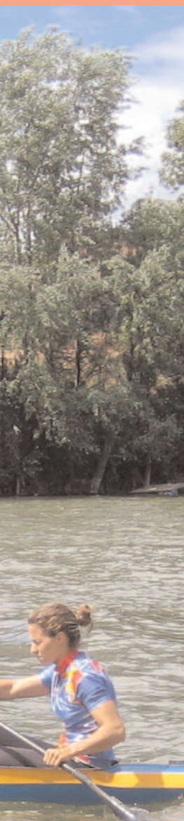
Palistas en las instalaciones del CTD de Río Esgueva.

menos debe avanzar al mismo ritmo y con un solo objetivo, aunque siempre haya que contemplar las singularidades de cada grupo de trabajo.