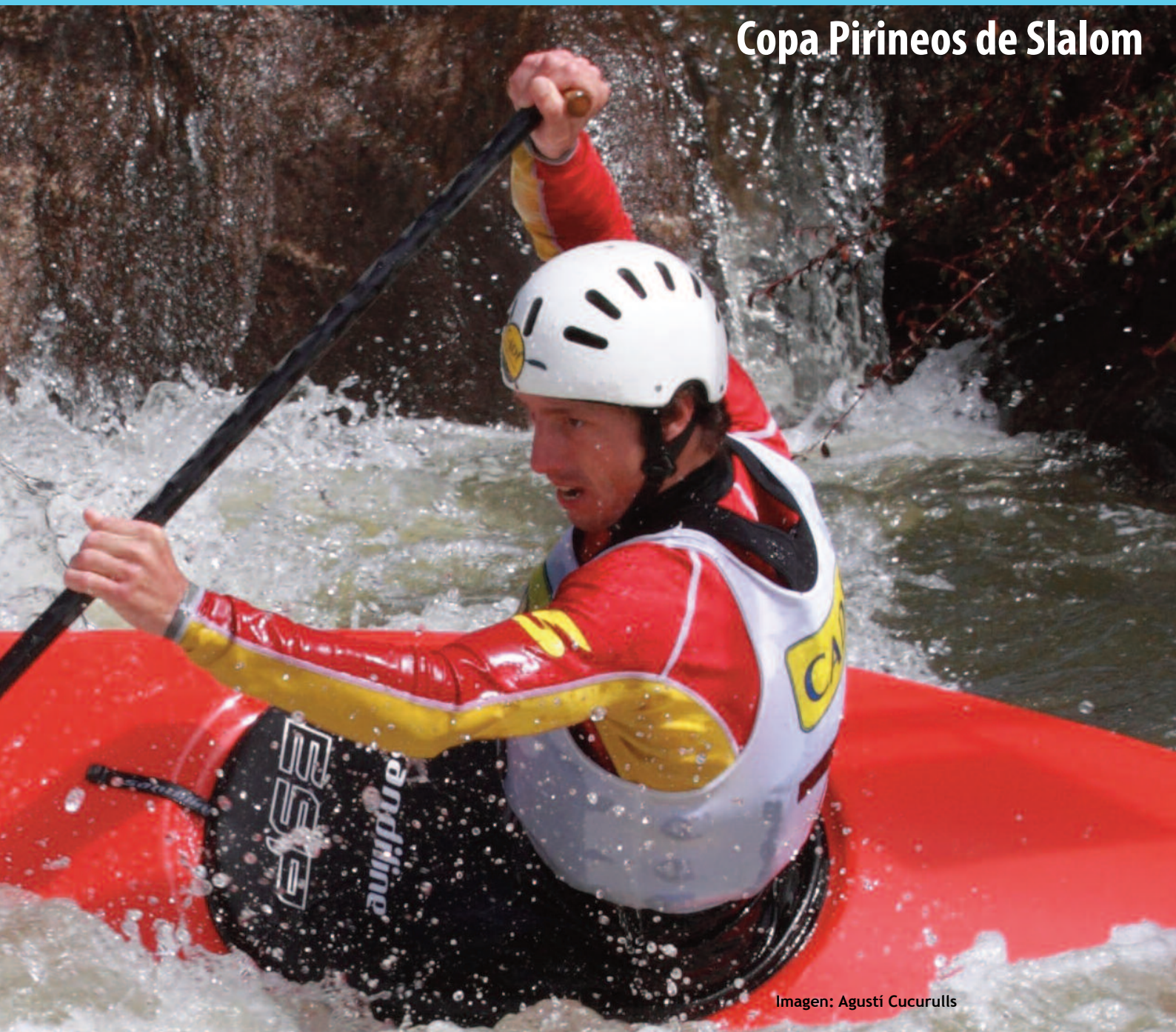
Imagen: Agustí Cucurull