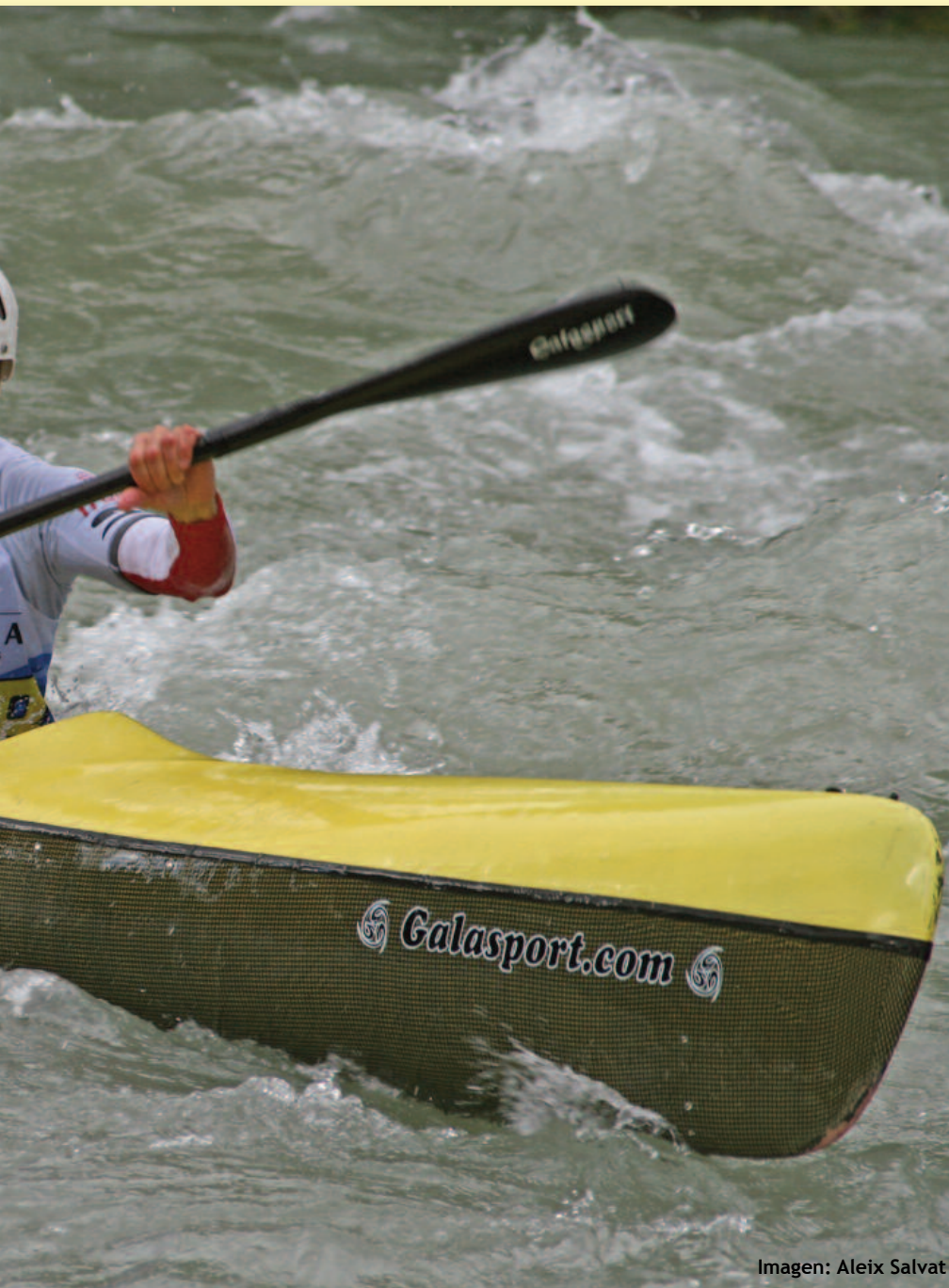
Imagen: Aleix Salvat

nta el presente y, o que vemos a nivel ugurar un despegue scenso en España”